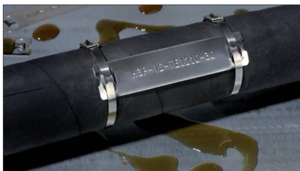
Merkesystem for krevende omgivelser: M-BOSS Lite stålskilt.