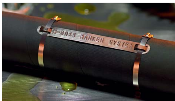
M-BOSS merker har god lesbarhet, også om de utsettes for smuss, olje og maling.