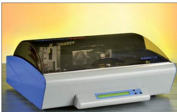
Plassbesparende og enkel å bruke: M-BOSS Lite system for preging av stålmerker.